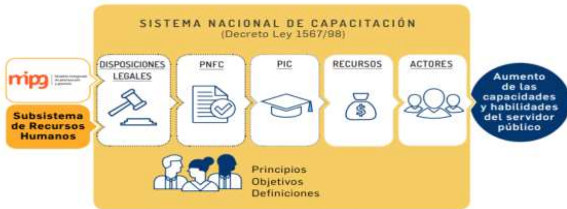
Fuente: Decreto ley 1567 de 1998

El fortalecimiento de los sistemas, las herramientas ofimáticas y la industria 4.0 que señala la función pública, son las más requeridas por los trabajadores en concordancia por las orientaciones dadas por MIPG; siendo esta justamente la segunda necesidad esbozada por los trabajadores que requieren conocer más las herramientas del Modelo Integrado, así como las metodologías para formulación de proyectos en el sector público.